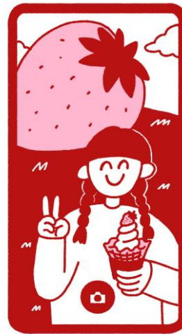
イベントイメージ画像②