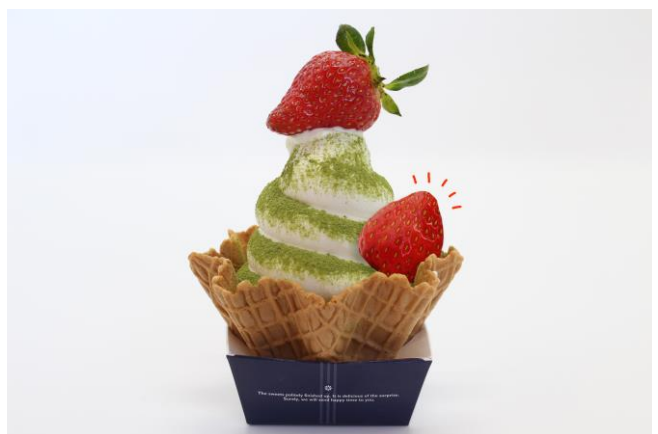
SNS 投稿でもう1ついちごをトッピング！

※2 SNS 投稿キャンペーンにおいて、てっぺんいちご購入後の SNS 画面ご提示はキャンペーン対象外となります。