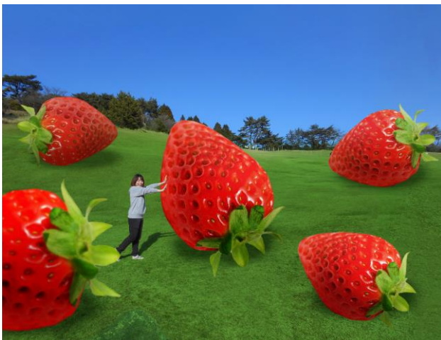
イベントイメージ画像①

※バルーンの劣化次第では、バルーンイベント期間中でも中止する可能性があります。予めご了承ください。